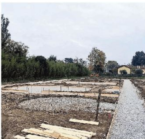
Il cantiere per la costruzione del parco Albero del tesoro

L'iniziativa è stata presentata ieri, nella giornata internazionale della disabilità. Con una donazione di 38 eu-