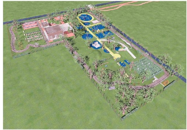
Il rendering del parco inclusivo Albero del tesoro che sta nascendo in via Siena, vicino al Basso Isonzo