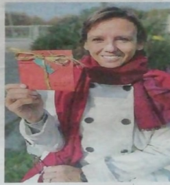
UNA VOLONTARIA In mano la busta per la beneficenza