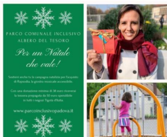
Per un Natale che vale

“Per un Natale che vale” è la campagna natalizia del Parco comunale inclusivo Albero del Tesoro, che sta nascendo a Padova e che ha bisogno di tutti: grazie al sostegno di chi vorrà contribuire la giostra musicale accessibile “Rapsodia” andrà ad aggiungersi agli altri giochi, privi di barriere architettoniche dove tutti potranno stare insieme e divertirsi senza ostacoli.